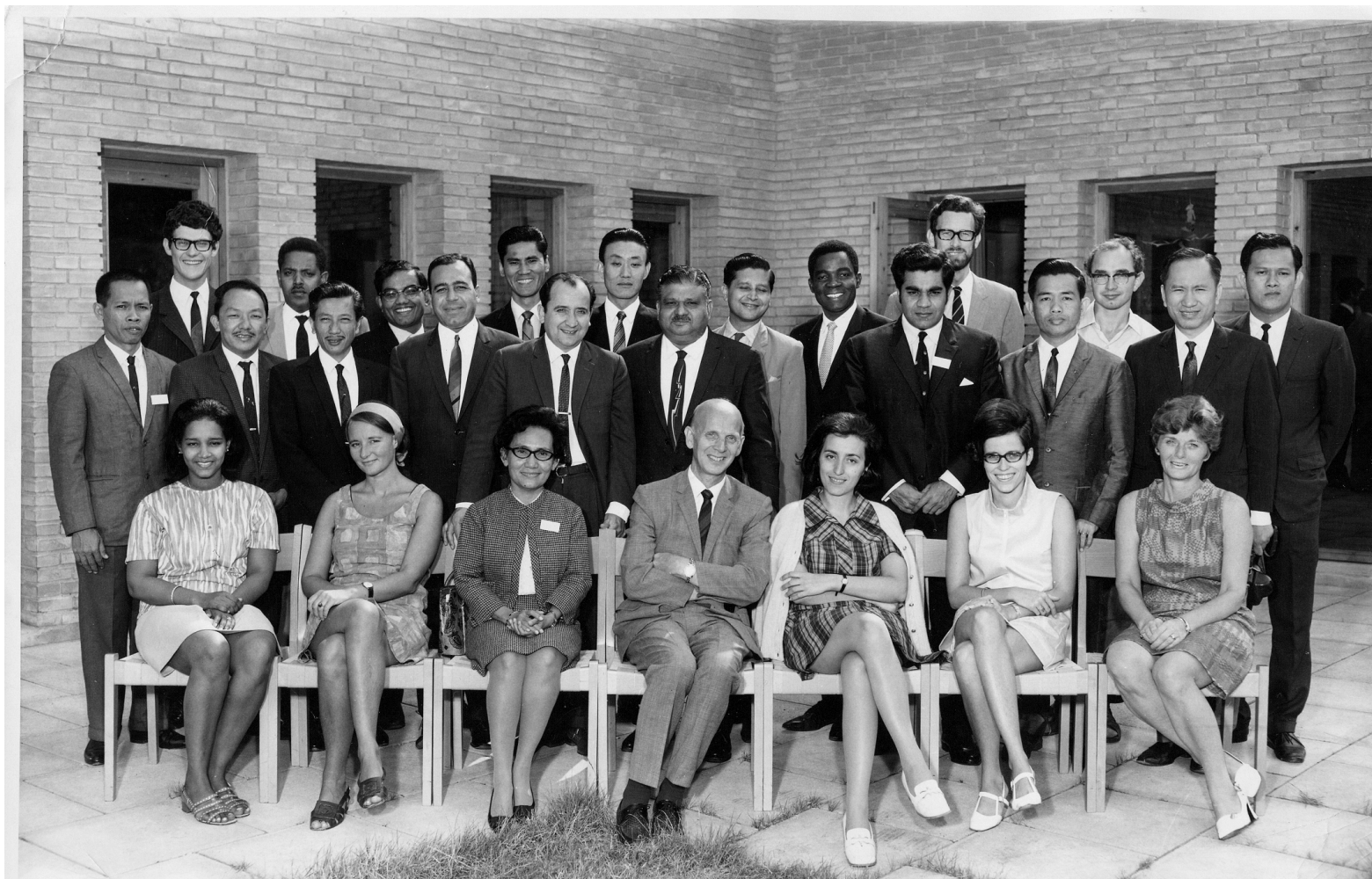
WORLD HEALTH ORGANIZATION TRAINING COURSE ON RADIATION PROTECTION

COPENHAGEN AUGUST 4 TH - AUGUST 30 TH 1969