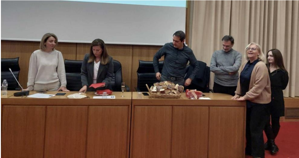
Κοπή της βασιλόπιτας της ΕΦΙΕ

Ευχαριστούμε για την παρουσία τους την πρόεδρο της ΕΦΟΜΡ, τους διευθυντές των Μεταπτυχιακών Προγραμμάτων Ιατρικής Φυσικής, τον πρόεδρο της ΕΛΕΝΕΠΥ, τον πρόεδρο της ΠΕΦΝΑΙΔΗΤ και τη νομική σύμβουλο της ΕΦΙΕ. Ιδιαίτέρως ευχαριστούμε την Εταιρεία ΚΑΡΒΩΝΗΣ για την ευγενική προσφορά της στην εκδήλωση και όλους τους χορηγούς της ΕΦΙΕ για την παρουσία και τη διαρκή στήριξή τους στις δράσεις μας.